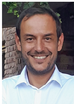
Veranstalter: Ludwig Loretz